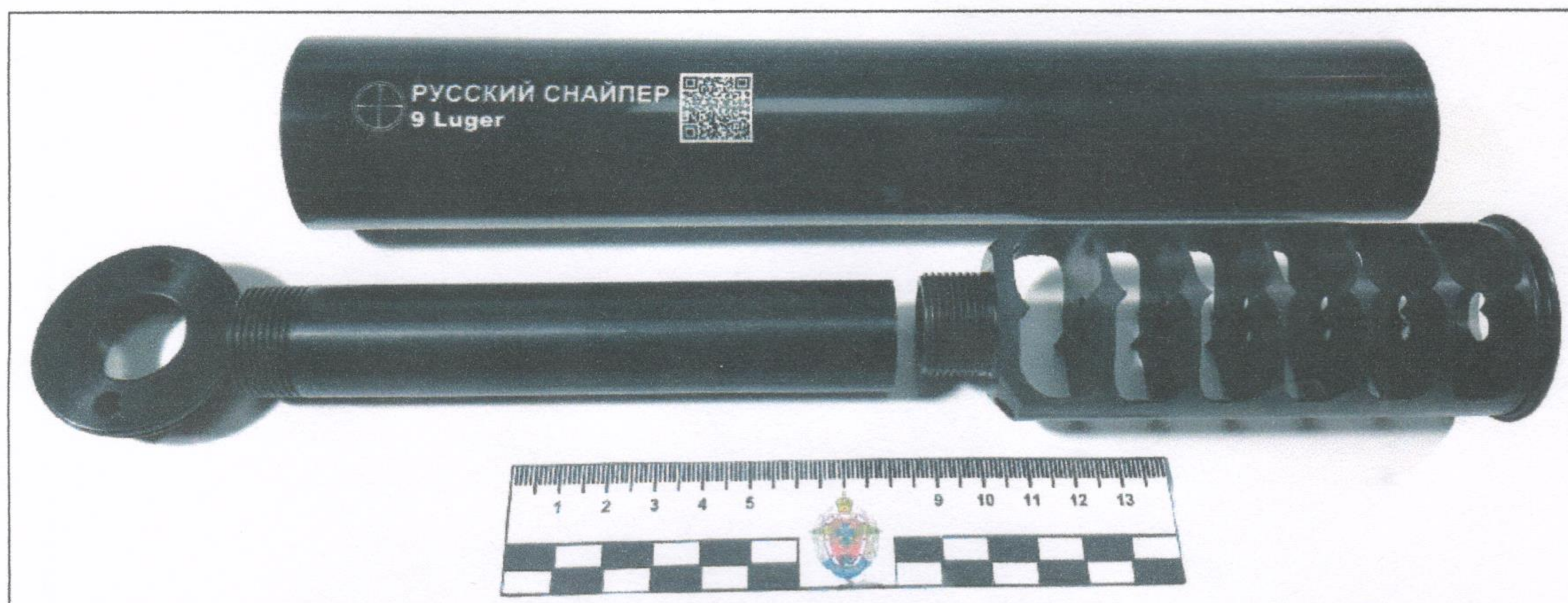
Исследование №2. Объект в разобранном виде.