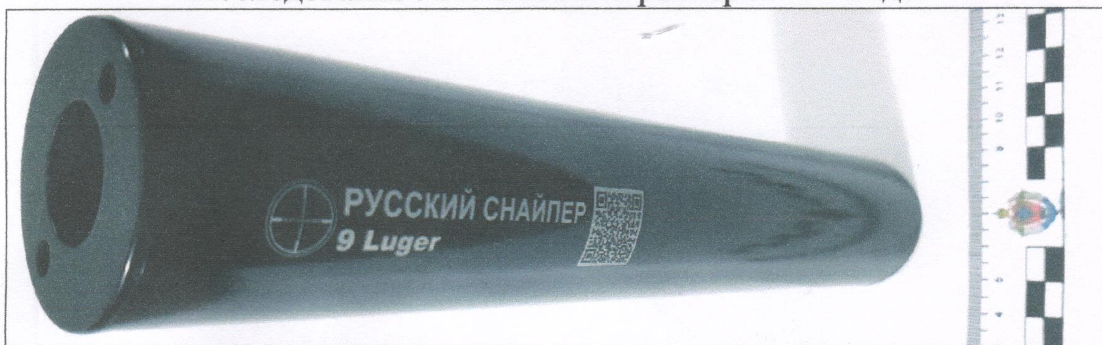
Исследование №3. Вид передней части представленного объекта.