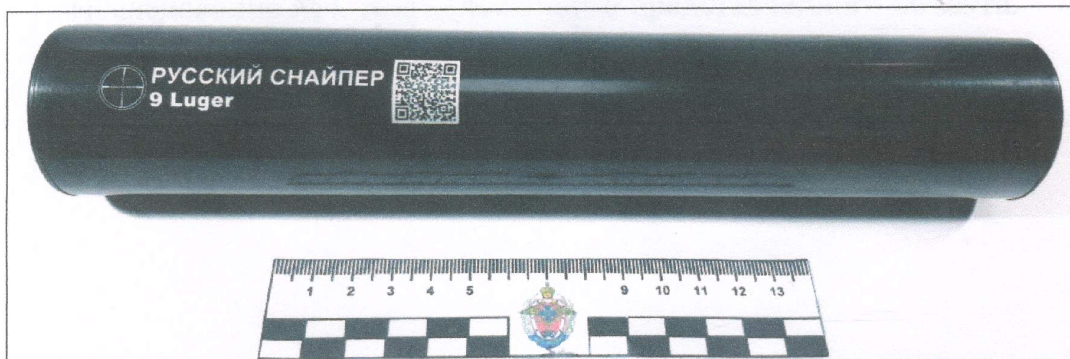
Исследование №1. Представленный на исследование объект.